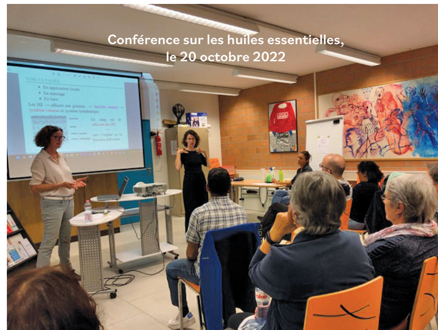
Conférence sur les huiles essentielles, le 20 octobre 2022