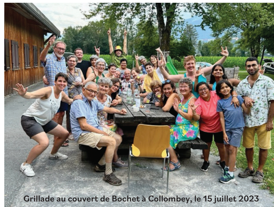
Grillade au couvert de Bochet à Collombey, le 15 juillet 2023