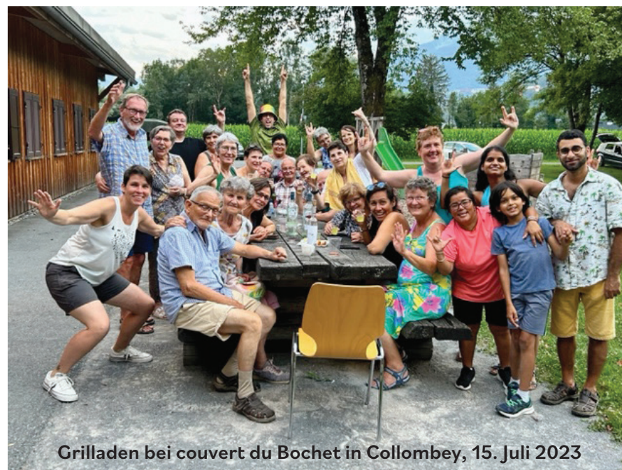
Grilladen bei couvert du Bochet in Collombey, 15. Juli 2023