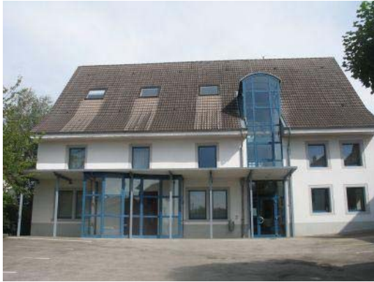
Courgenay, centre paroissial et culturel