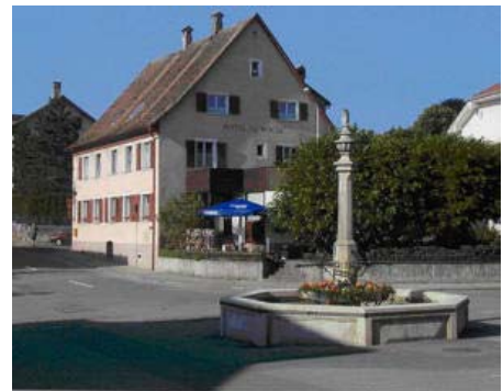
Restaurant du Boeuf